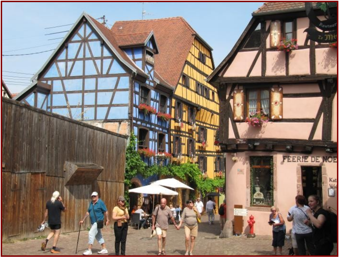
De belles maisons bien colorées et dans le bas une enseigne de restaurant