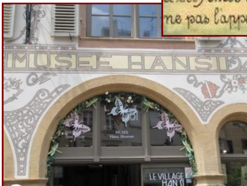
La façade du Musée Hansi