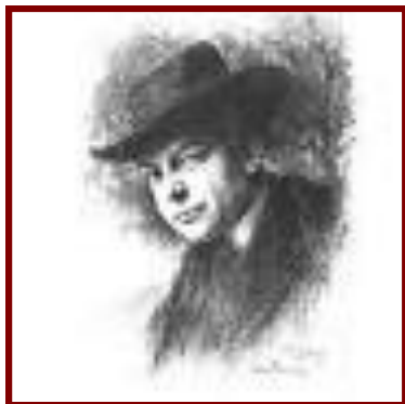
Le portrait de Jean-Jacques Waltz et l'une de ses œuvres

Après le repas très bon et bien servi nous partons pour visiter le « Musée HANSI » ou nous découvrons l'histoire et les œuvres originales de Jean-Jacques WALTZ né à COLMARD en 1873.