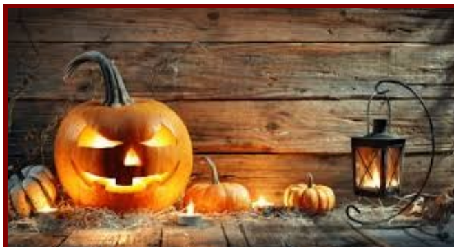
Citrouille sculptée et lanterne « Jack-O'-Lanternes »