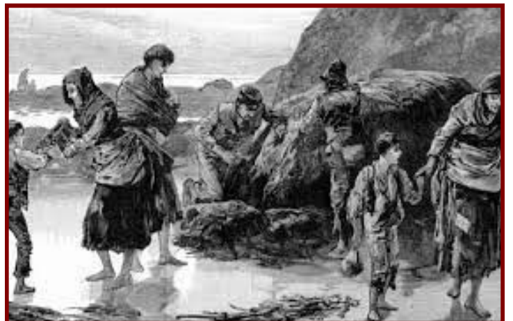
La Grande Famine Irlandaise