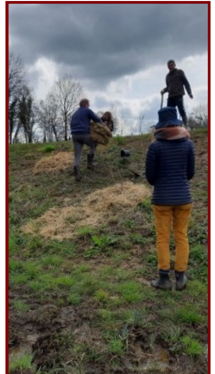
L'équipe responsable du paillage