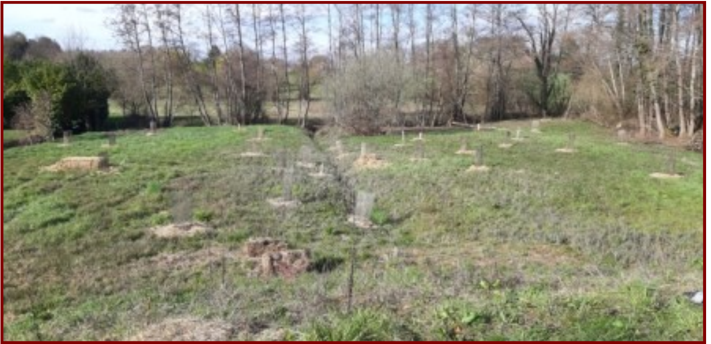
Un petit aperçut des plantations réalisé