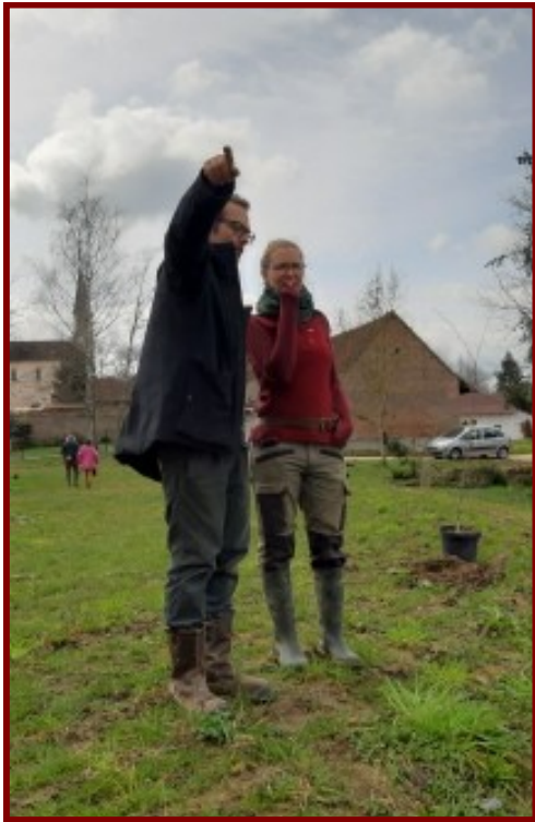
Il est 09h00, les responsables dirigent le travail