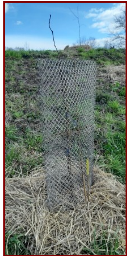
Les plantations fragiles sont protégées par un grillage