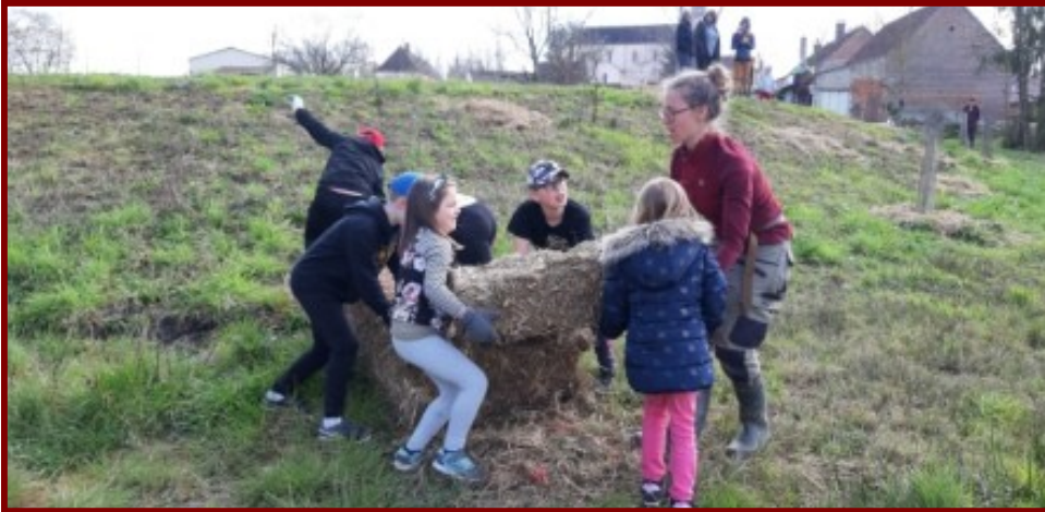
Des adultes aux enfants tout le monde s'active, ici la paille . . .