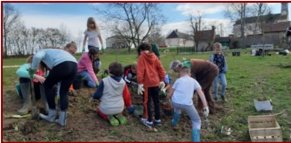
Des adultes aux enfants tout le monde s'active joyeusement