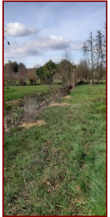
Nous apercevons les nouvelles plantations