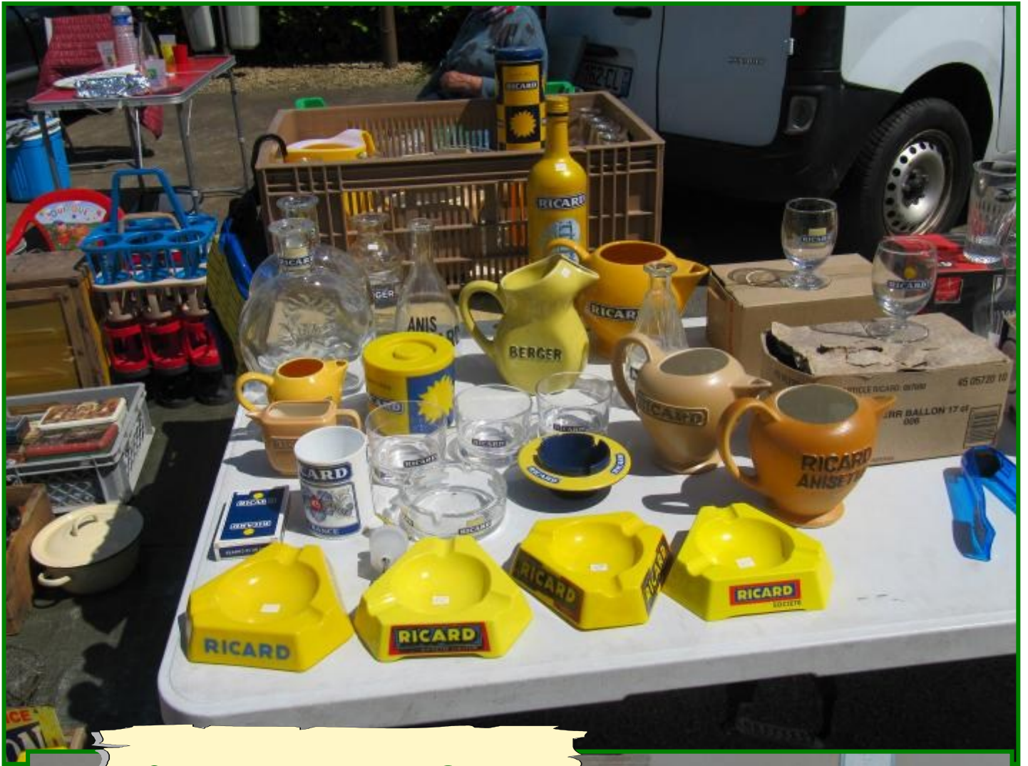
Une belle collection Ricard