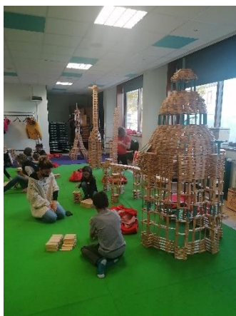
Animation Kapla – Evènement famille du 23 octobre 2021 à Mervans