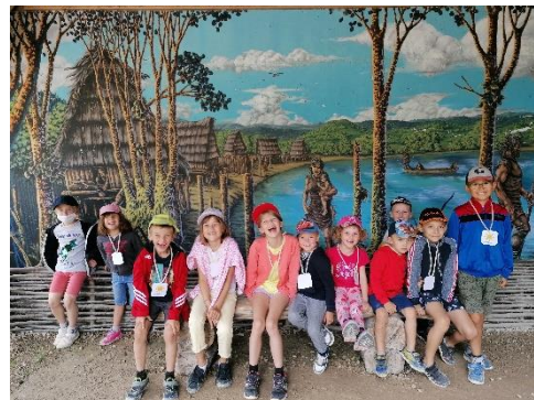
Journée à Dinozoo – Été 2021