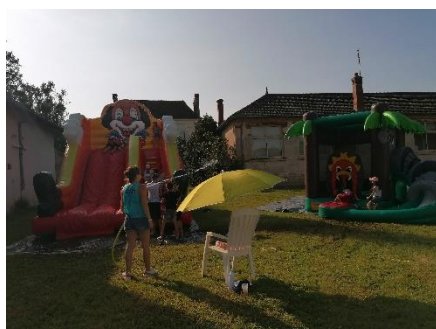
Dernier jour de l'accueil de loisirs – Été 2021