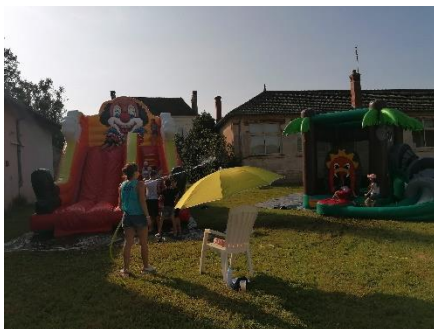
Dernier jour de l'accueil de loisirs – Été 2021