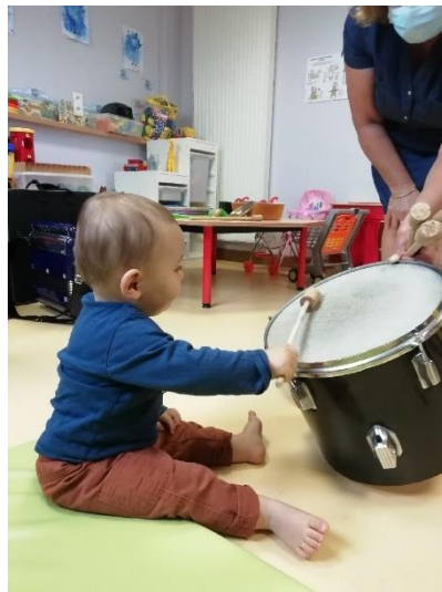
Eveil musical au Relais Petite Enfance