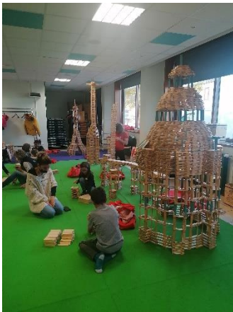
Animation Kapla – Evènement famille du 23 octobre 2021 à Mervans