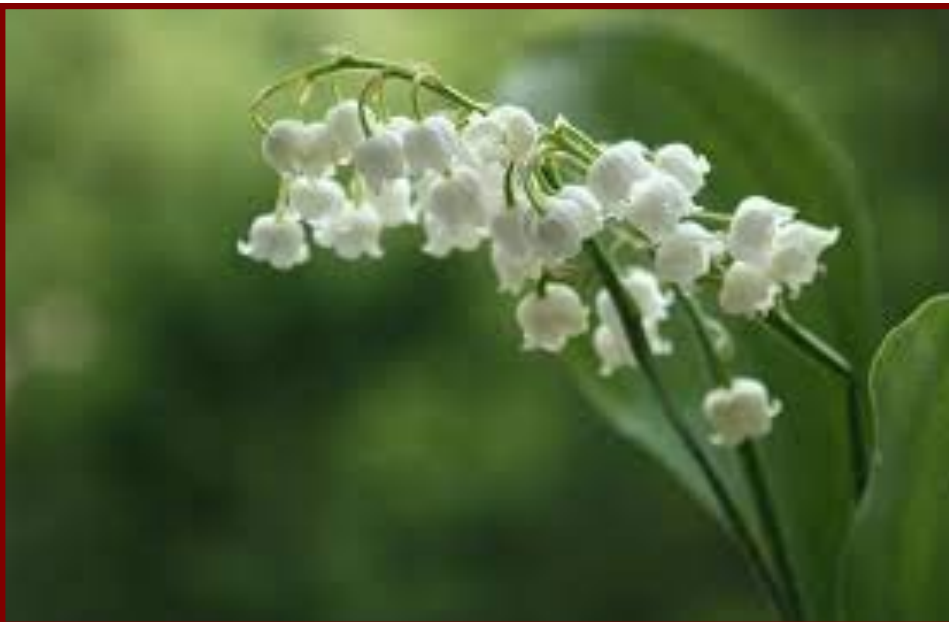
Brins de muguet

Charmé par cette attention le Roi Charles IX aurait fait de