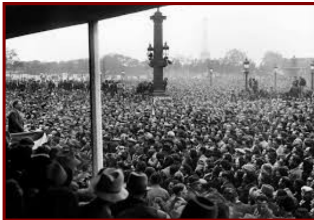
Les manifestations de 1889