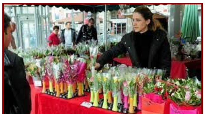
Des vendeurs de muguet : indépendants et fleuriste

« en petites quantités », à plus de 100 mètres d'un fleuriste et sans utiliser de table, tout en prenant garde à ne pas gêner piétons et véhicules.