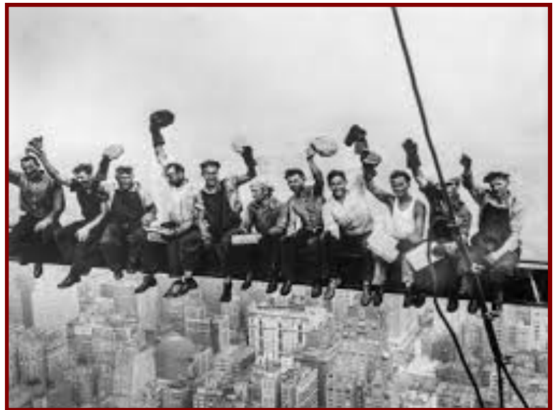
Des ouvriers en grèves au dessus du vide

Ce jour-là, elles ont été nombreuses à être paralysées par ces mouvements de contestations. Chicago a été mise à feu et à sang, avec des émeutes violentes et même l'explosion d'une bombe, faisant des dizaines de morts.