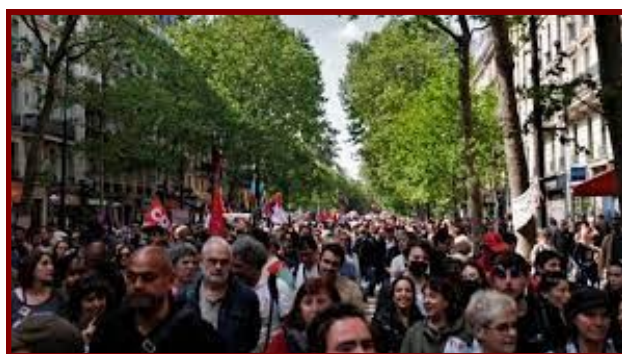
Les manifestations de nos jours