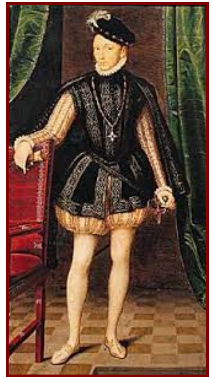
Charles IX Roi de France

Sur le continent Nord-Américain, le « labour day » est férié mais il a lieu le premier Lundi de Septembre.