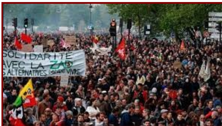
Les manifestations de nos jours