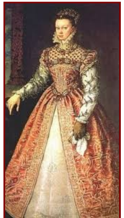
Catherine de Médicis