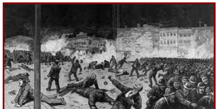
Le 1 er Mai 1886. Les manifestations de Chicago créent de nombreux morts Le 1 er Mai 1886