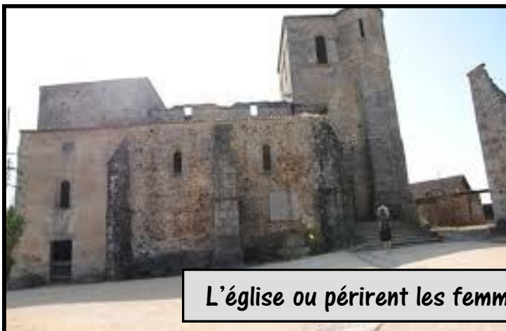
L'église où périrent les femmes et les enfants