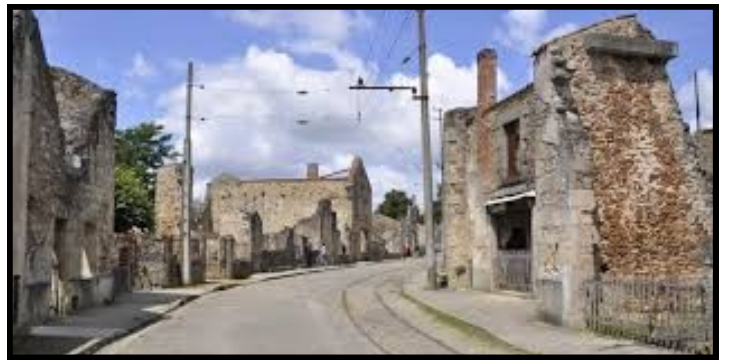
Le Commandant responsable de ce massacre est le Stumbannführer-SS Adolf DIEKMANN