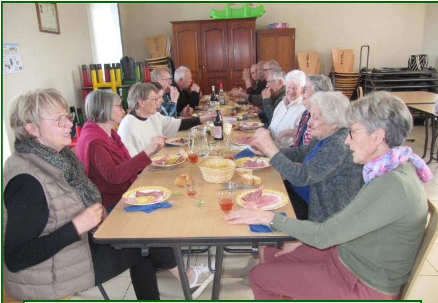
Ambiance conviviale à toutes les tables