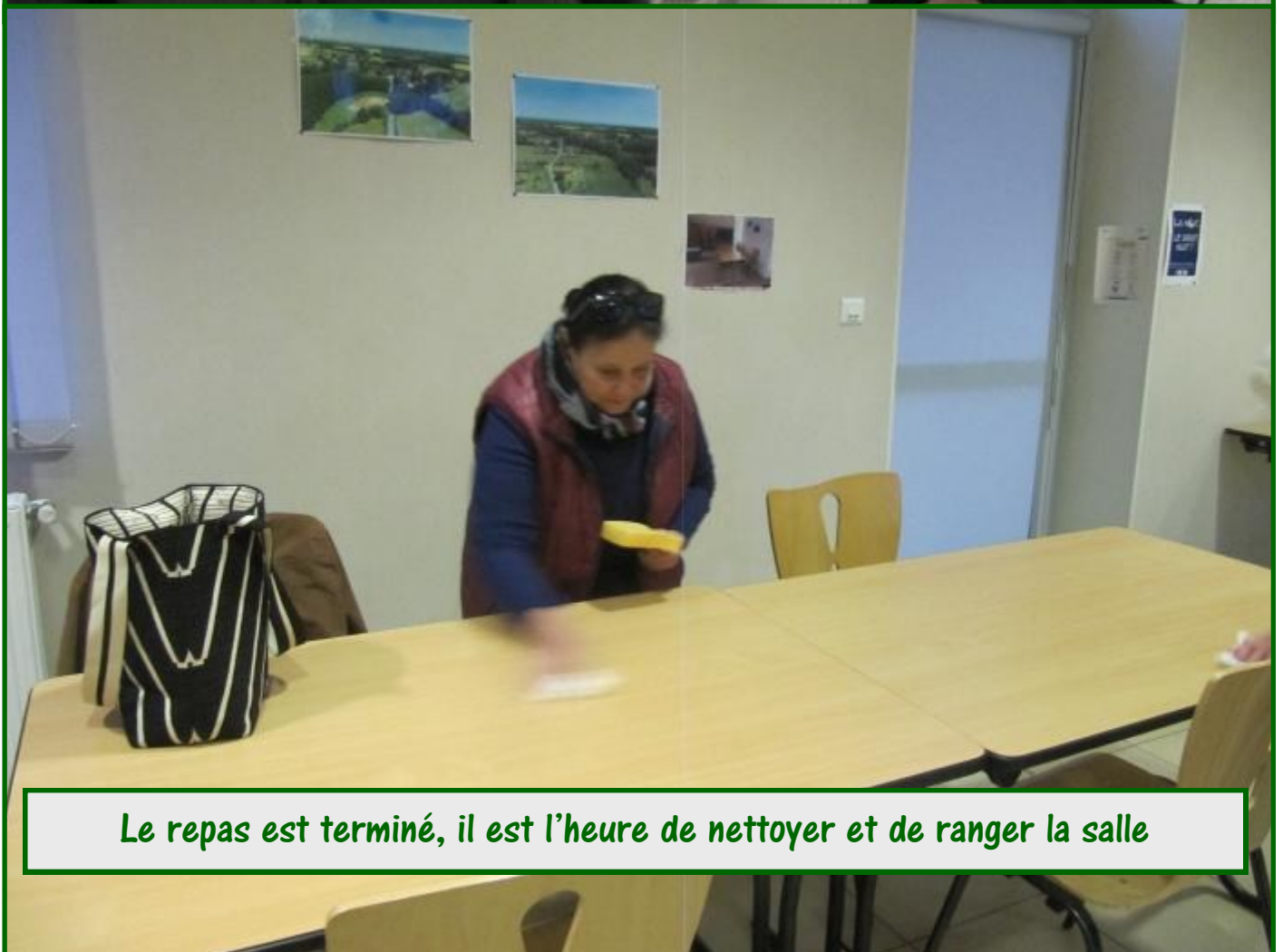
Le repas est terminé, il est l'heure de nettoyer et de ranger la salle