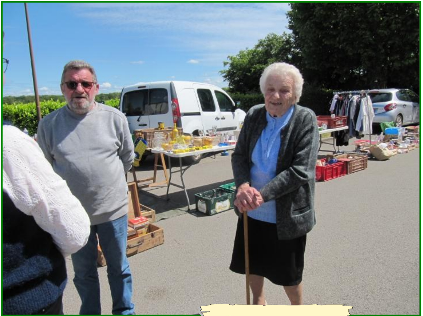
La doyenne en visite