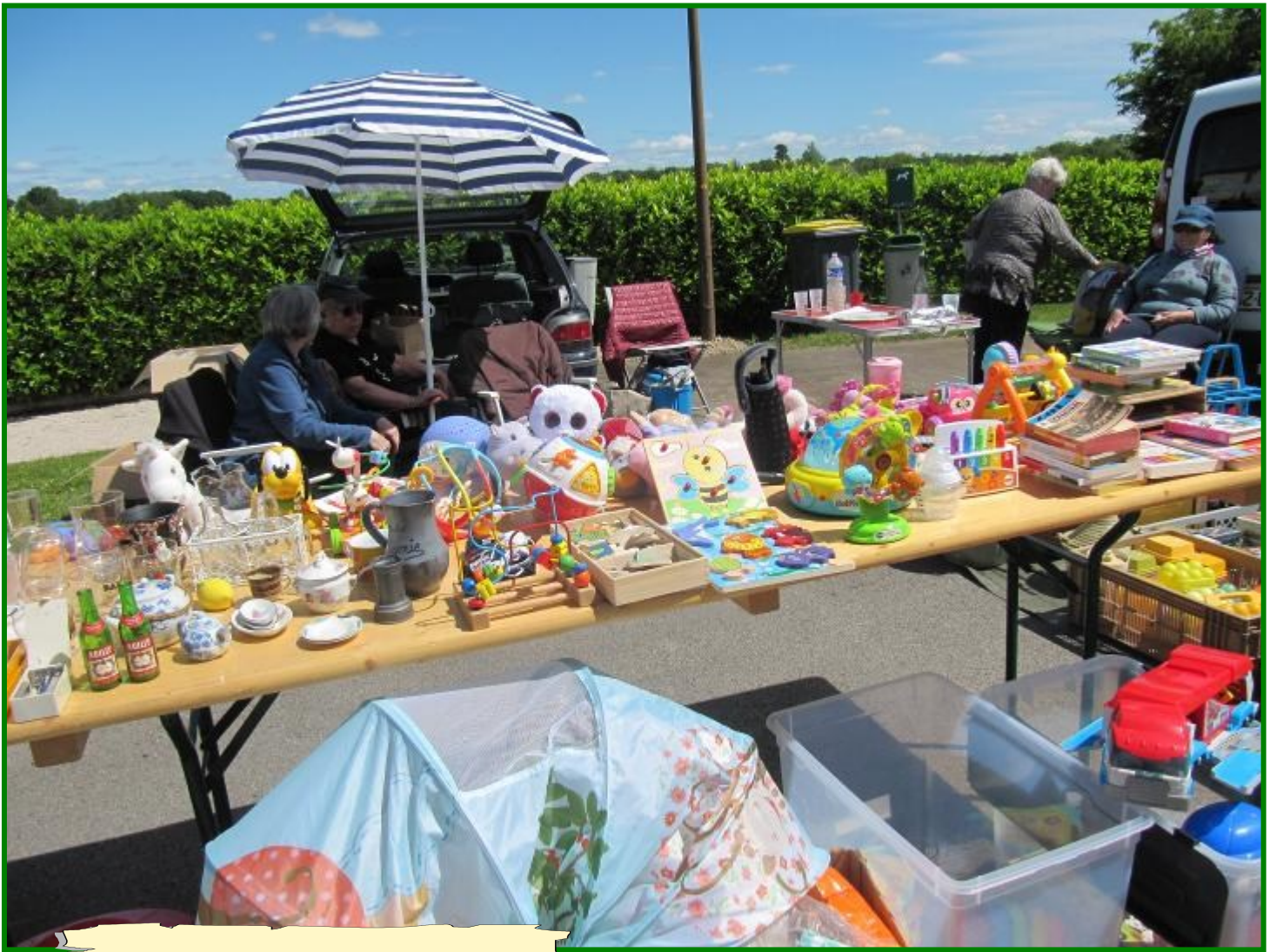
Un aperçu des stands