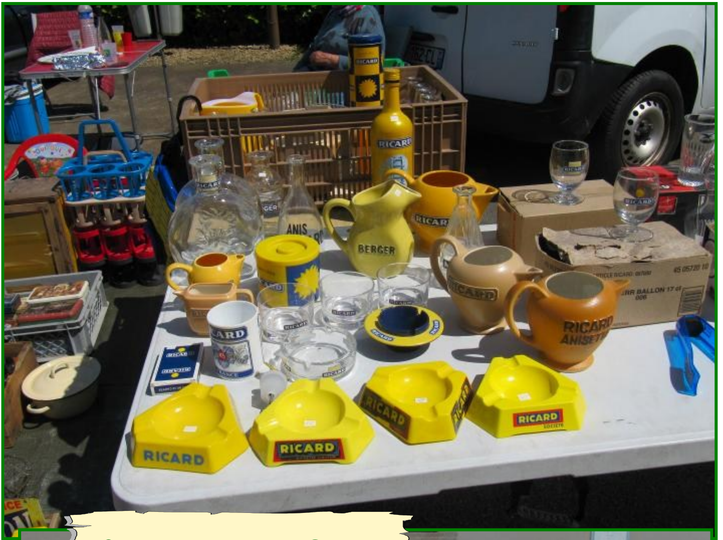
Une belle collection Ricard