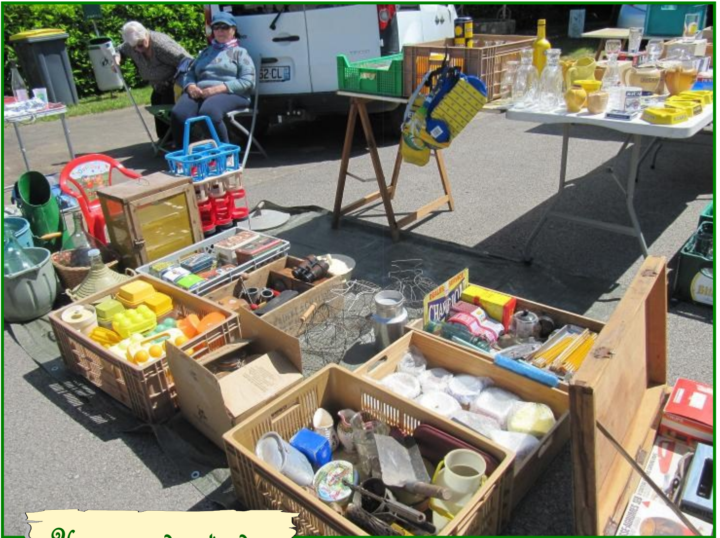
Un aperçu des stands